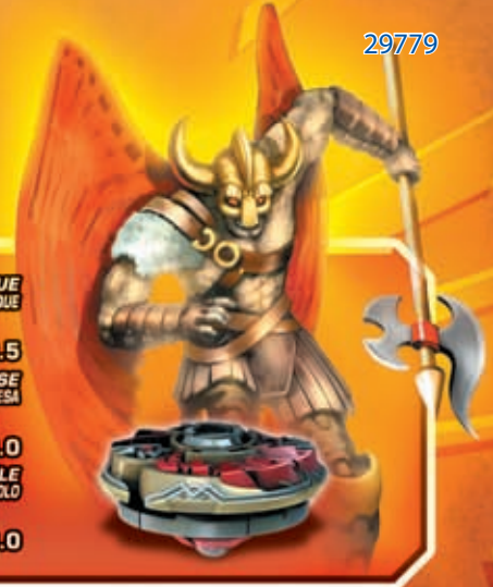
VALKYRIA™ TEAM PALADIN™